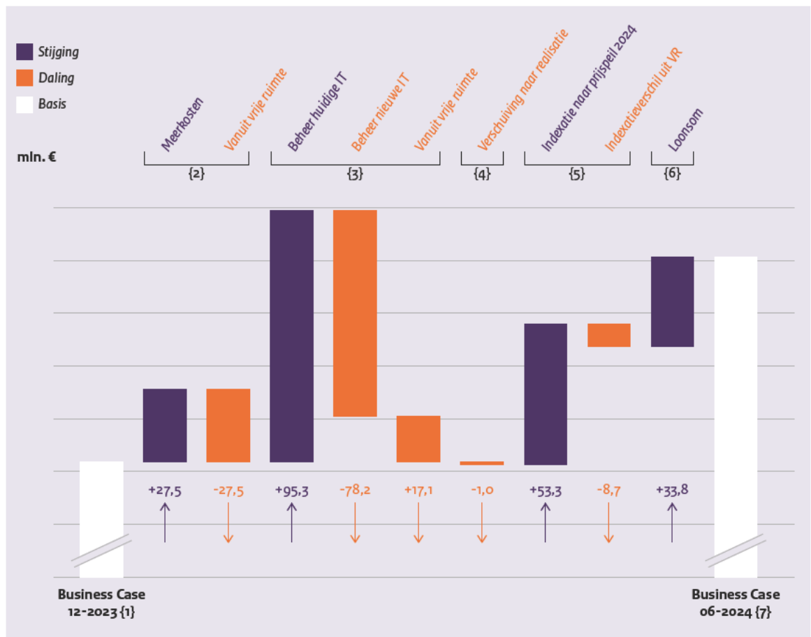
Figuur 3 Financiële ontwikkeling exploitatiekosten per 30 juni 2024