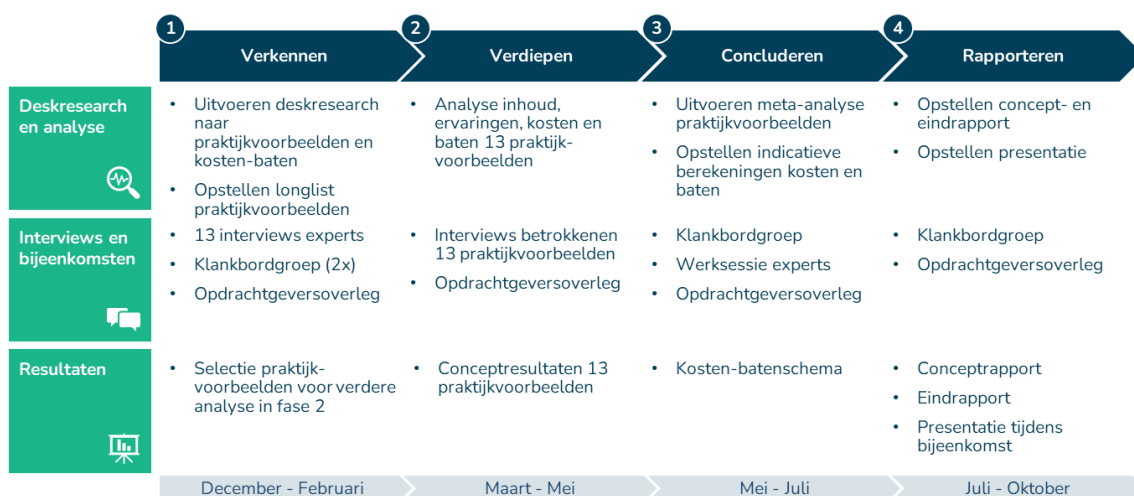
Figuur 5. Het onderzoek bestond uit vier fasen.

We voerden het onderzoek uit in vier fasen (Figuur 5).