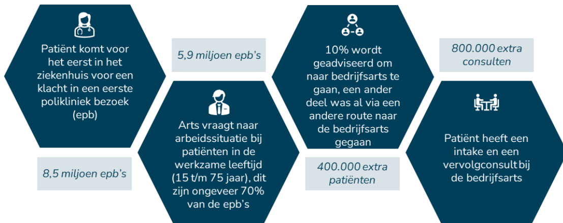
Figuur 4. Belangrijkste stappen in de patiëntreis en schatting van het aantal patiënten in Nederland.

tijdsinzet €240 miljoen per jaar (bijlage 4 voor meer details over de exacte berekening), wat neerkomt op €40 per patiënt.