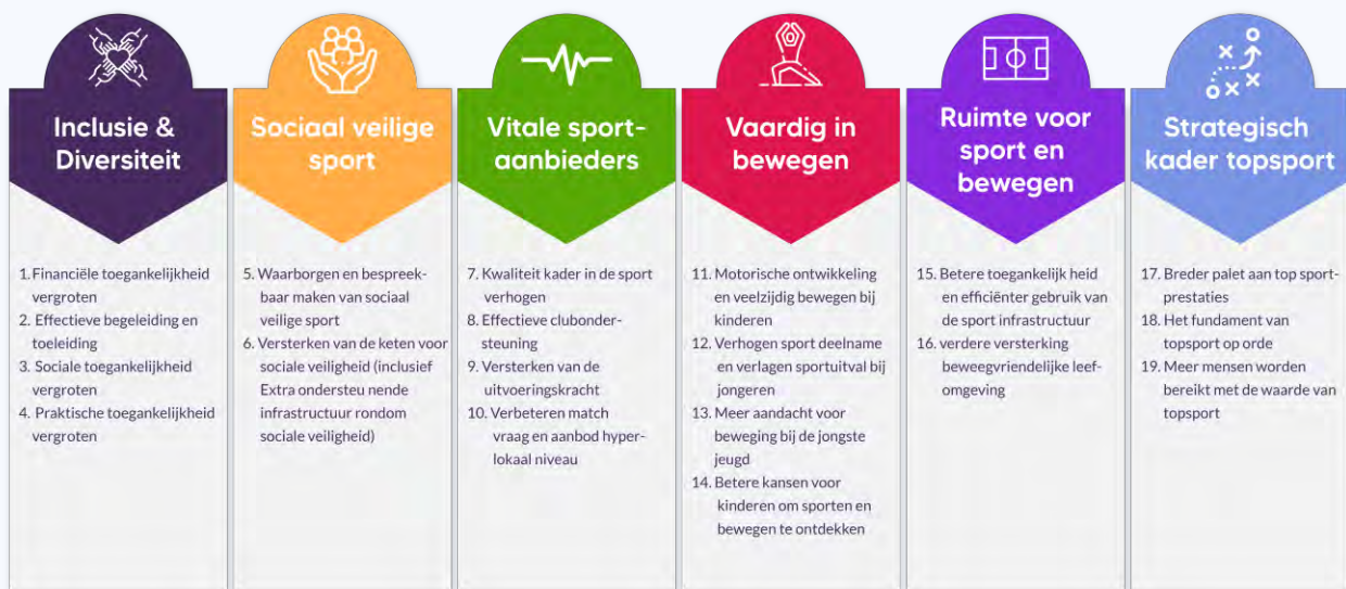
Figuur 1.1 Sportakkoord II: thema's en opgaven

Per thema zijn twee tot vier opgaven geformuleerd. In totaal zijn er negentien opgaven (zie figuur 1.1 ). In de vorige voortgangsrapportage (Hoogendam et al., 2024) staat de achtergrond van SAIL nader toegelicht.