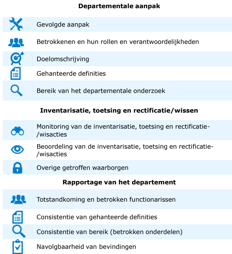
Tabel 4 Onderzochte aspecten