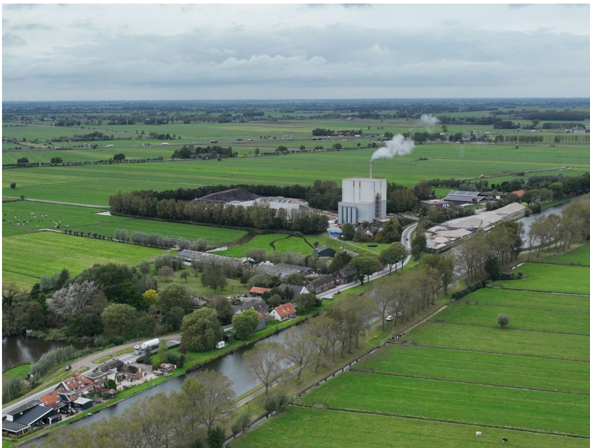
Figuur 1: APH met op de voorgrond lintbebouwing