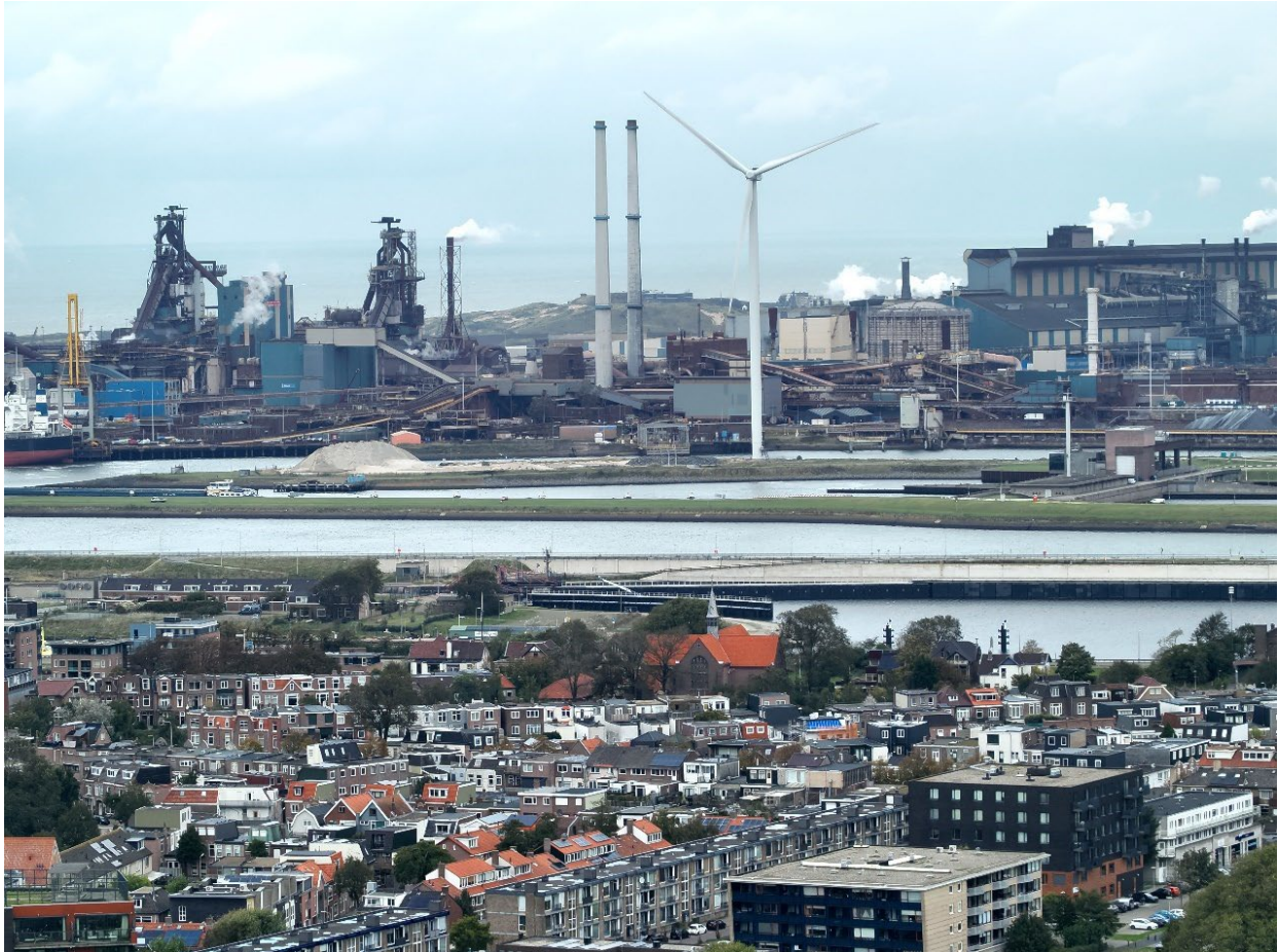
Figuur 5: IJmuiden, met op de achtergrond Tata Steel

Tata Steel stoot daarnaast volgens de Emissieregistratie van alle Nederlandse bedrijven de meeste stikstofoxiden ( \text{NO}_2 ) uit. Blootstelling aan \text{NO}_2 kan irritatie en ontsteking van de luchtwegen, de ogen, keel en neus veroorzaken. Door hoge concentraties van \text{NO}_2 kan het aantal astma-aanvallen en ziekenhuisopnamen toenemen. Het komt ook voor dat mensen gevoeliger worden voor infecties. Je wordt dan bijvoorbeeld sneller verkouden. (RIVM, 2023) Bovendien reageren \text{NO}_x -deeltjes in de lucht weer met andere deeltjes en vormen samen fijnstof. Het RIVM geeft aan dat vooral fijnstof, \text{NO}_2 , PAK's en een aantal metalen rondom Tata Steel belangrijk zijn vanuit het oogpunt van gezondheid, evenals hinder. De meeste winst voor de gezondheid in de IJmond is te bereiken door de hinder door en blootstelling aan uitstoot van Tata Steel te verminderen (RIVM, 2023).