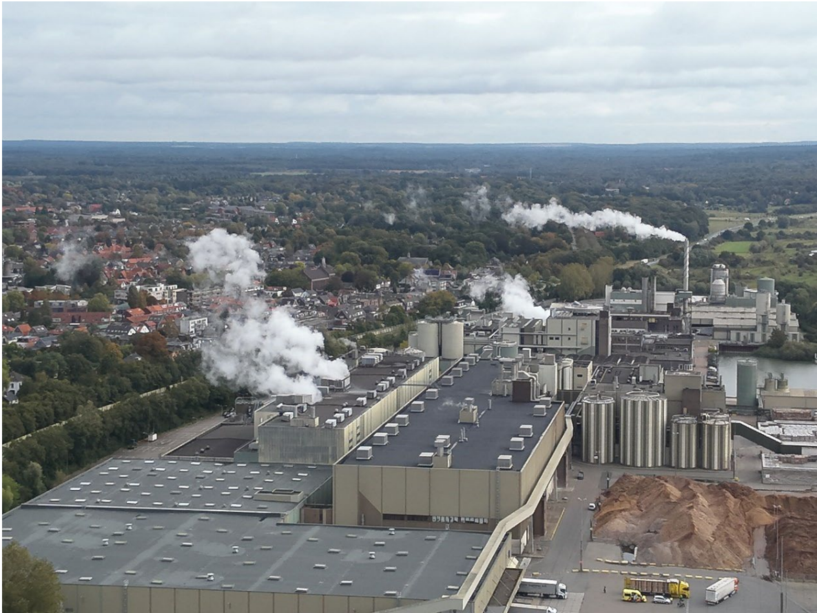
Figuur 4: SKP, met links het dorp Renkum