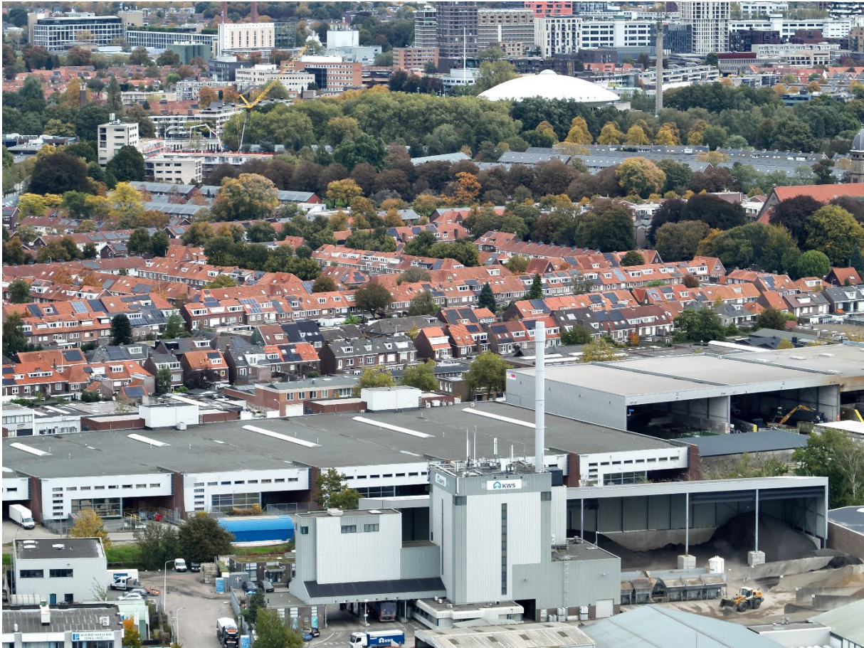
Figuur 2: ACE, met op de achtergrond Eindhoven