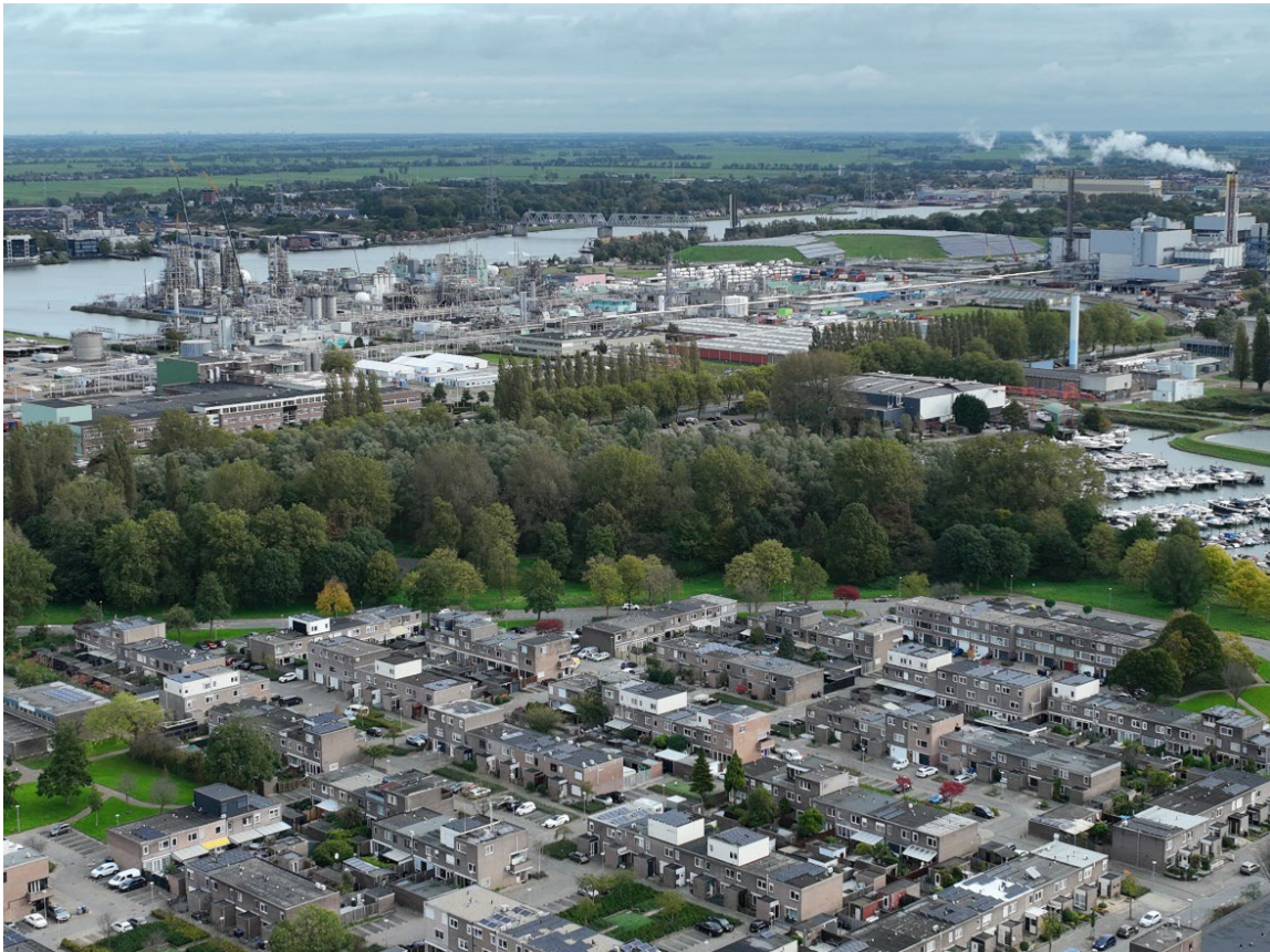
Figuur 1: Dordrecht, met op de achtergrond Chemours