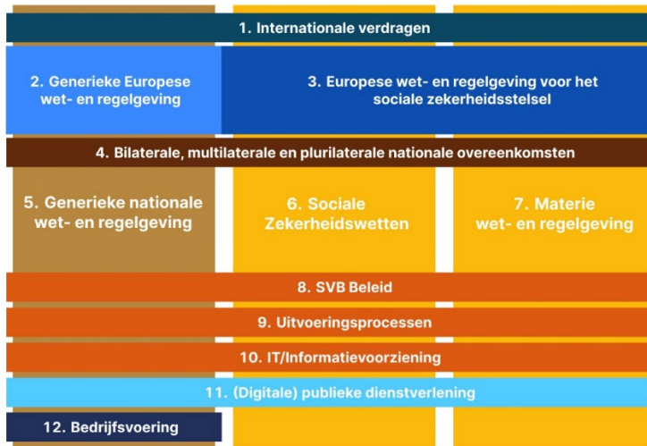
Afbeelding: De SVB werkt aan vereenvoudiging op meerdere niveaus

In 2025 werkt de SVB verder op projectmatige wijze verder aan vereenvoudiging. Er is een vereenvoudigingstool ontwikkeld om projecten ten behoeve van interne vereenvoudiging op een projectmatige manier verder te brengen.