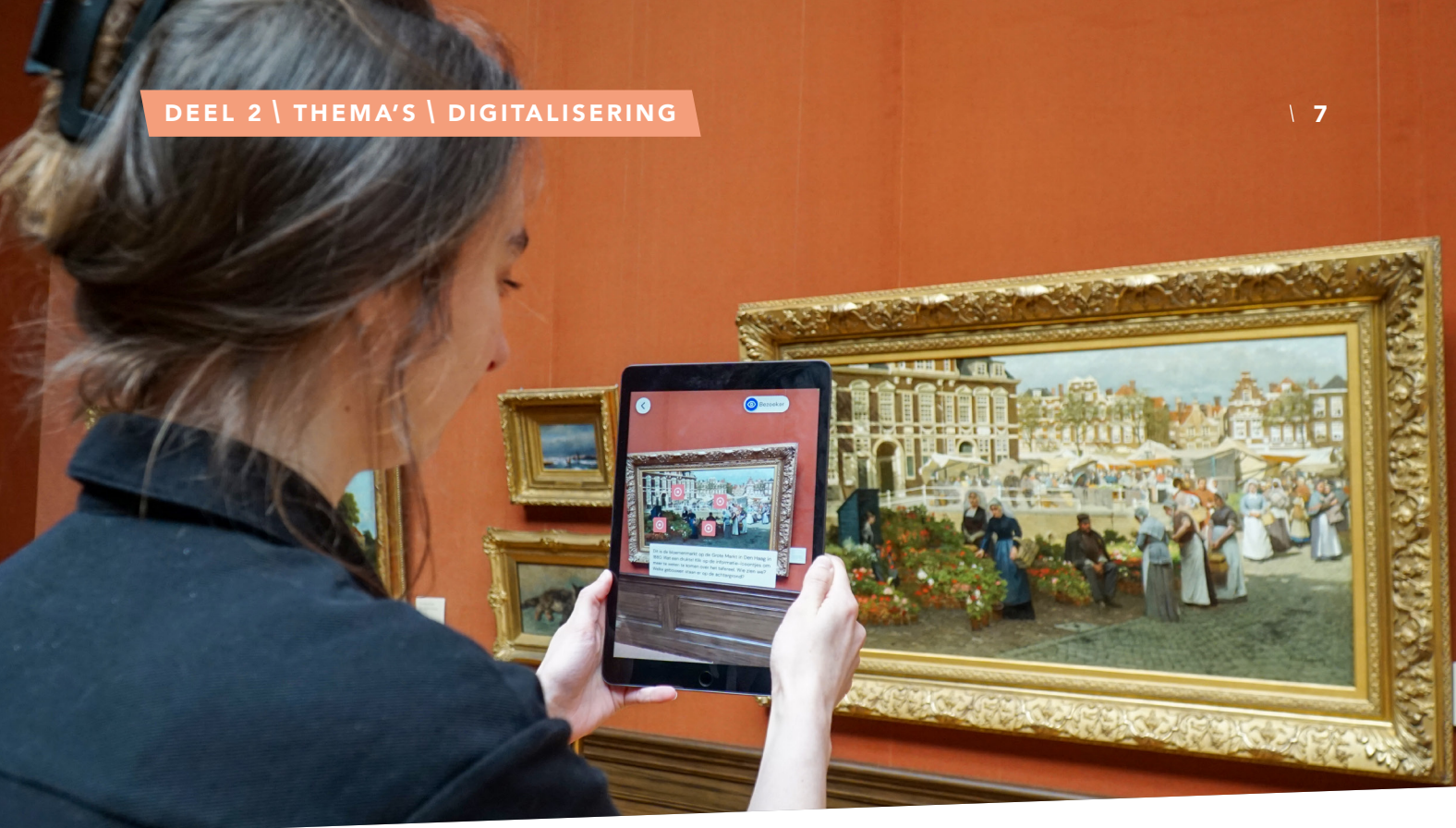
Tentoonstelling 'De Grote Illusie. 200 jaar Virtual Realities'. Teylers Museum 2024.