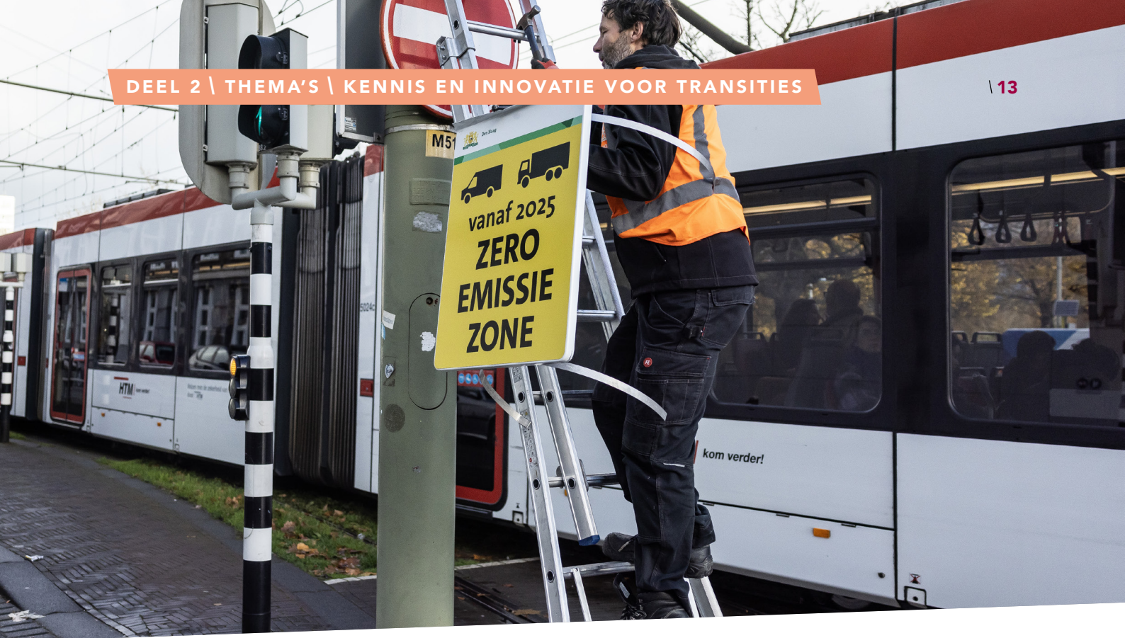
Zero-emissie zone Den Haag.