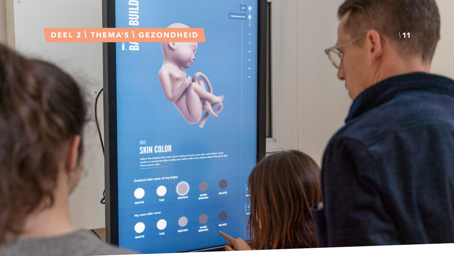
Baby Builder, installatie van kunstenaar Bertrand Burgers op de Dutch Design Week 2021.