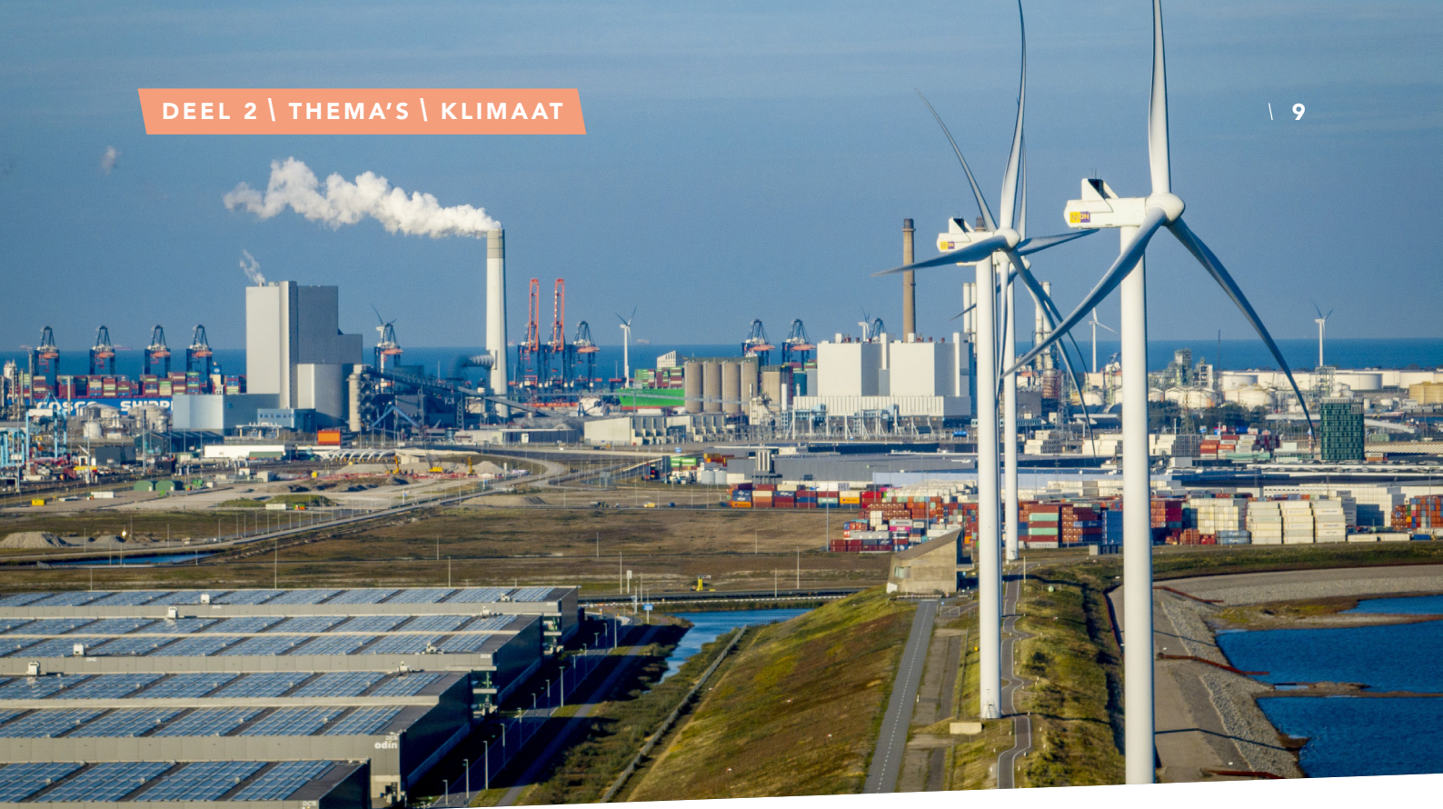
Tweede Maasvlakte in de haven van Rotterdam.