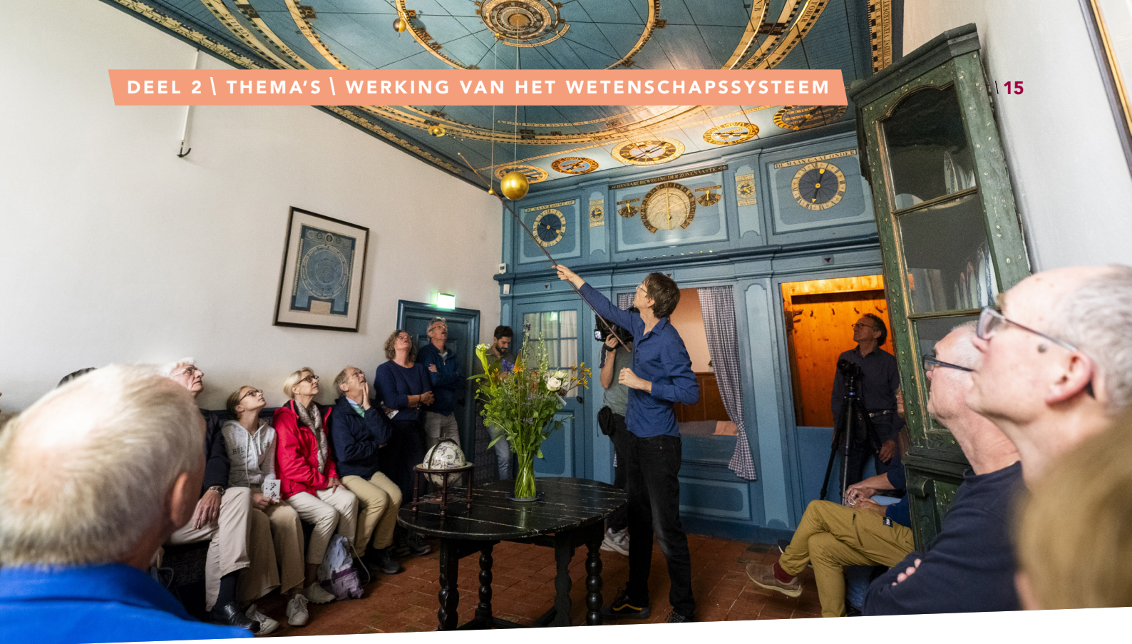
Het Eise Eisinga Planetarium in Franeker, in 2023 uitgeroepen tot werelderfgoed.