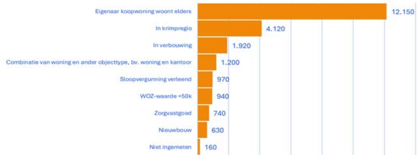
Figuur 3. Mogelijke verklaringen structurele leegstand na energiecorrectie, in aantallen woningen die aan één of meer verklarende kenmerken voldoen

Hiermee geef ik invulling aan de toezegging aan mevrouw Beckerman over een onderzoek naar verklarende kenmerken bij structureel leegstaande woningen voor het einde van 2024, gedaan tijdens het commissiedebat over ruimtelijke ordening van 2 oktober 2024 (TZ202410–049).