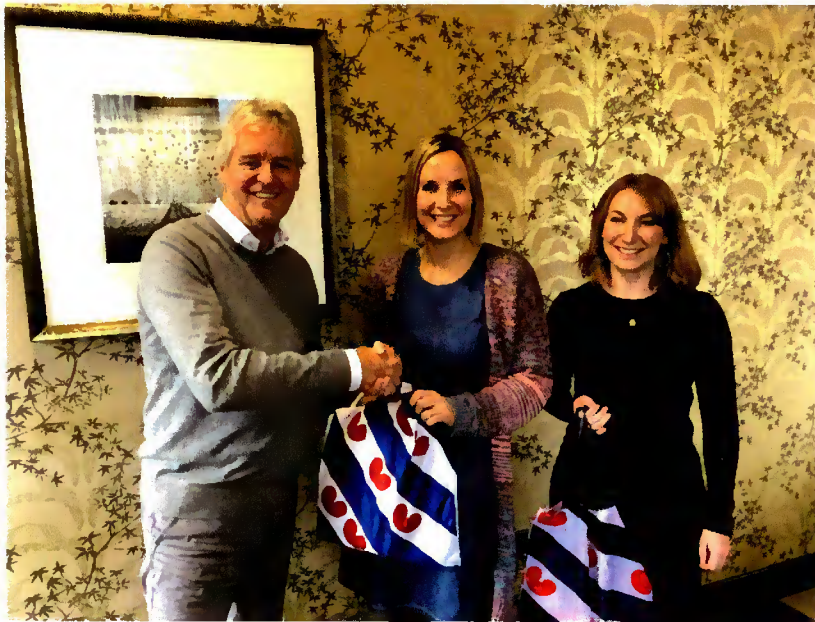
DINGtiid op bezoek in Wales

Leden van bestuur en/of staf hebben hiernaast nog overleggen gevoerd met of vergaderingen bijgewoond van onder andere Mei-inoar foar it Frysk, it Steatekomitee Frysk, Gemeenten&Frysk, de Politike Kommissje (POK) van de Ried fan de Fryske Beweging, Rijksuniversiteit Groningen, Fryske Akademy, Afûk, Tresoar, Europeesk Buro foar Lytse talen, Koninklijke Nederlandse Akademie van Wetenschappen, Rechtbank Noord-Nederland en Gerechtshof Arnhem-Leeuwarden, Gemeente Leeuwarden, Gemeente Waadhoeke, FNP, Vereniging Friese Gemeenten, Stichting Brede Maatskiplike Diskusje, Nationale Dorpentop, Planbureau Fryslân, Joodse School in Amsterdam, Sintrum Frysktalige Berne-opfang, Wy binne mbû, Fierder mei Frysk en Streektaalconferentie Stichting Nederlandse Dialecten.