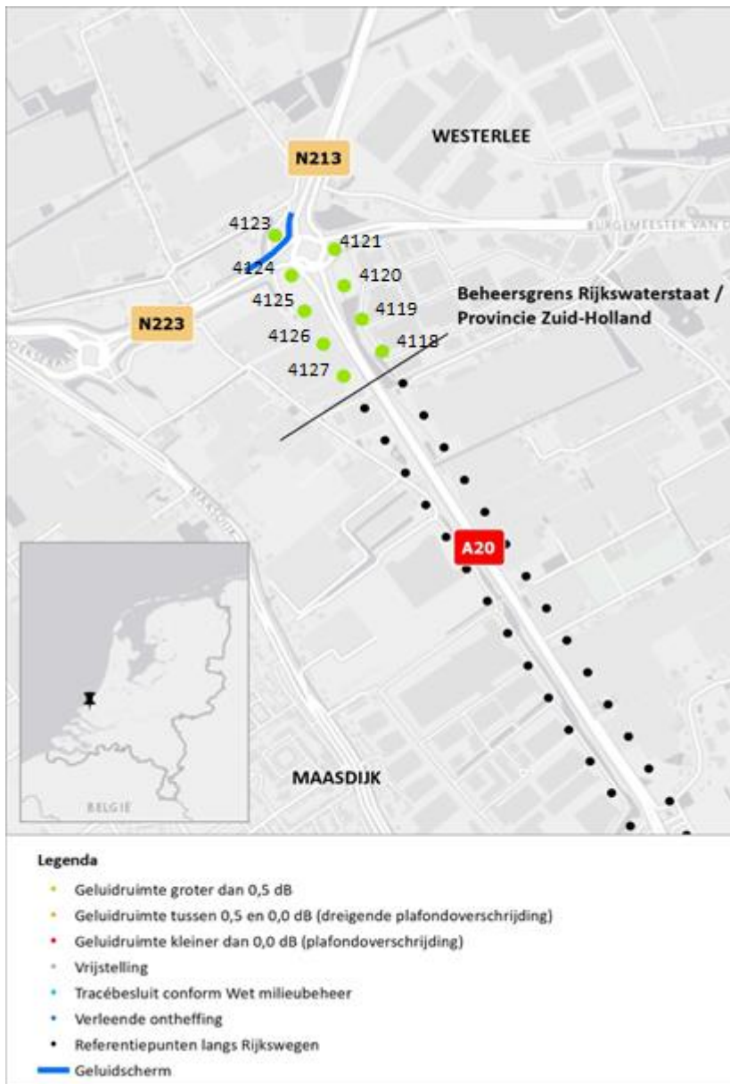
Figuur 2 Geluidruimte naleving 2023 t.o.v. geldende geluidproductieplafonds provinciale wegen