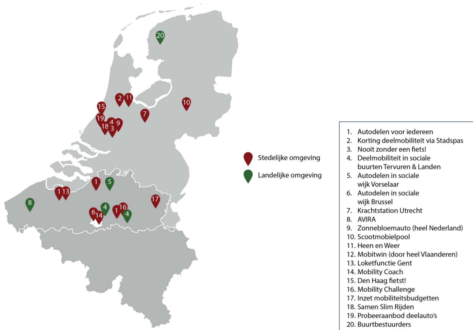
Figuur 1 Locatie:s van de 20 experimenten en projecten uit dit rapport.