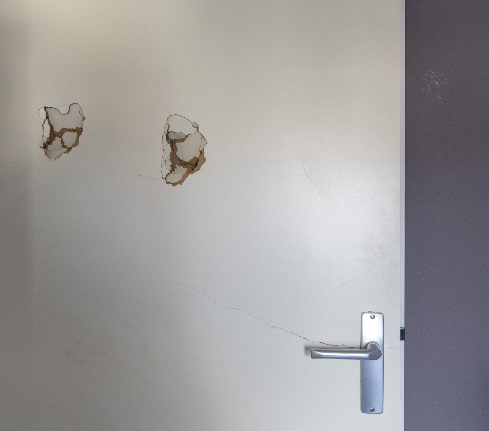
Agressie en geweld – ook dat kan tot een arbeidsongeval leiden.