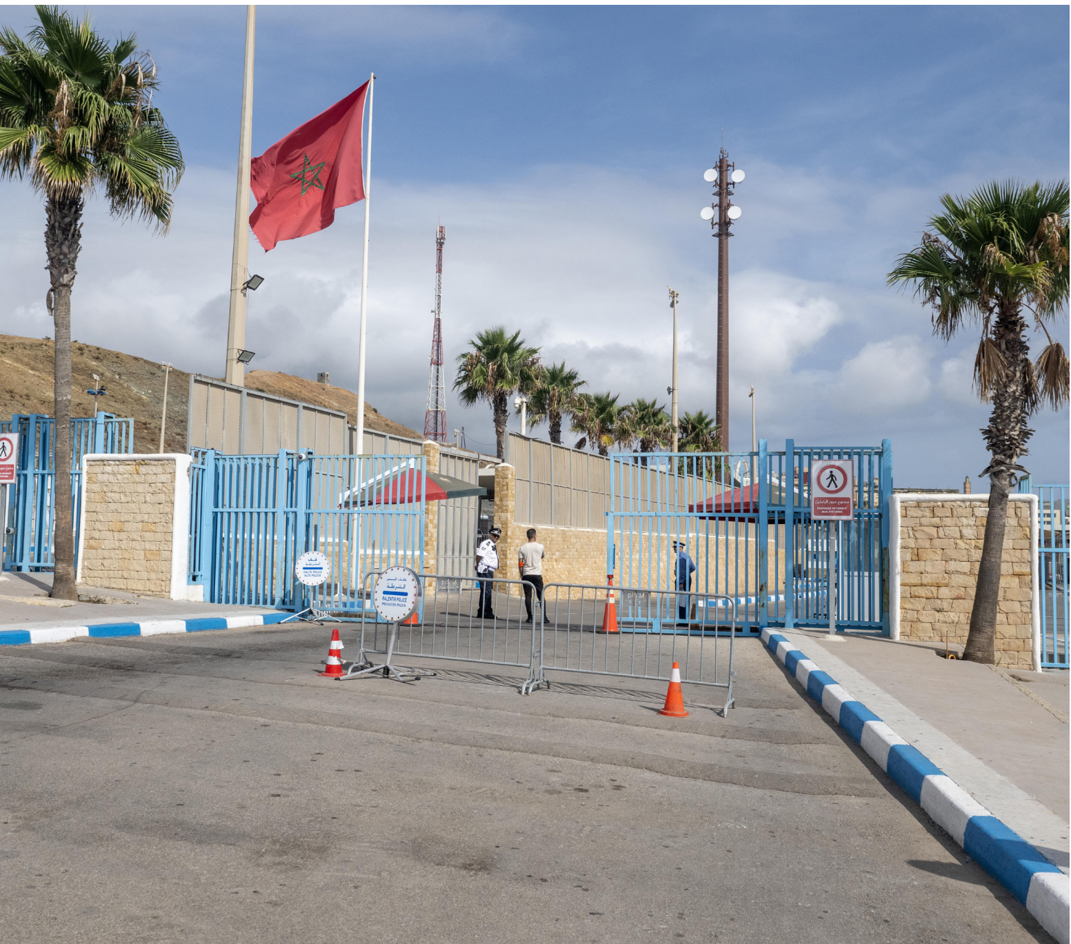
Security aan de grens van Marokko met de Spaanse enclave Ceuta, 2024.