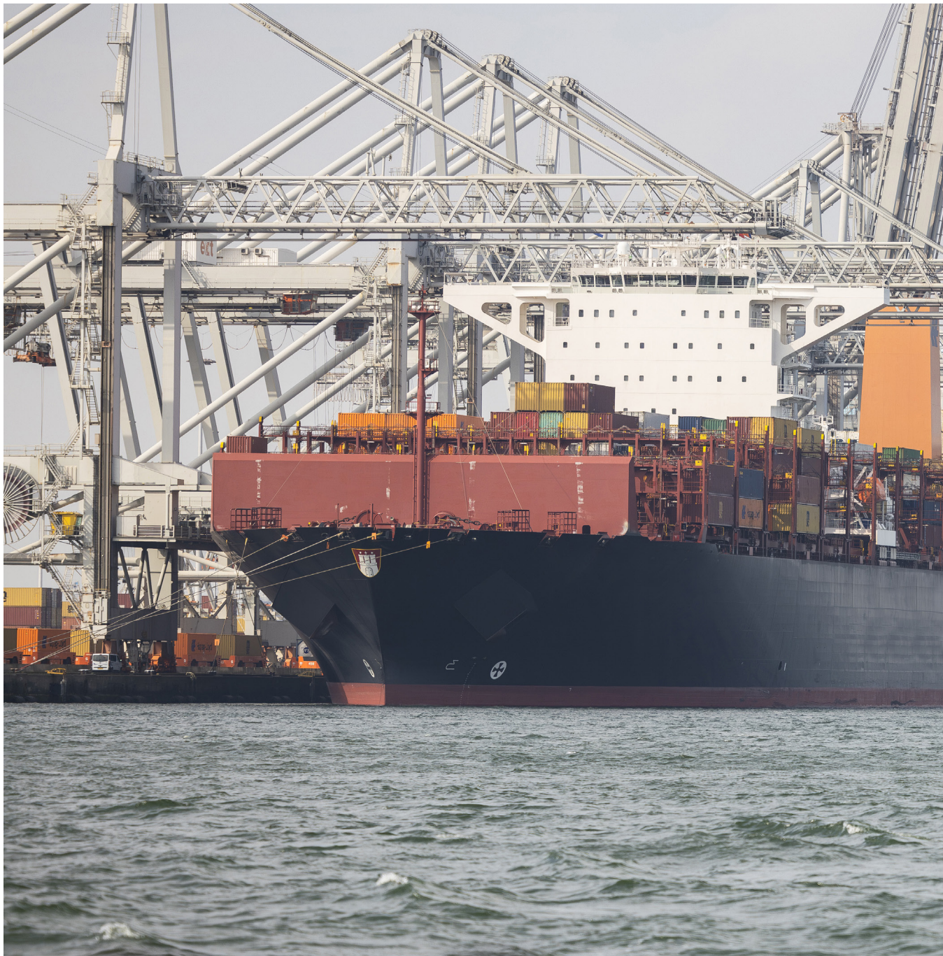
Een containerschip in de haven van Rotterdam, 2024.