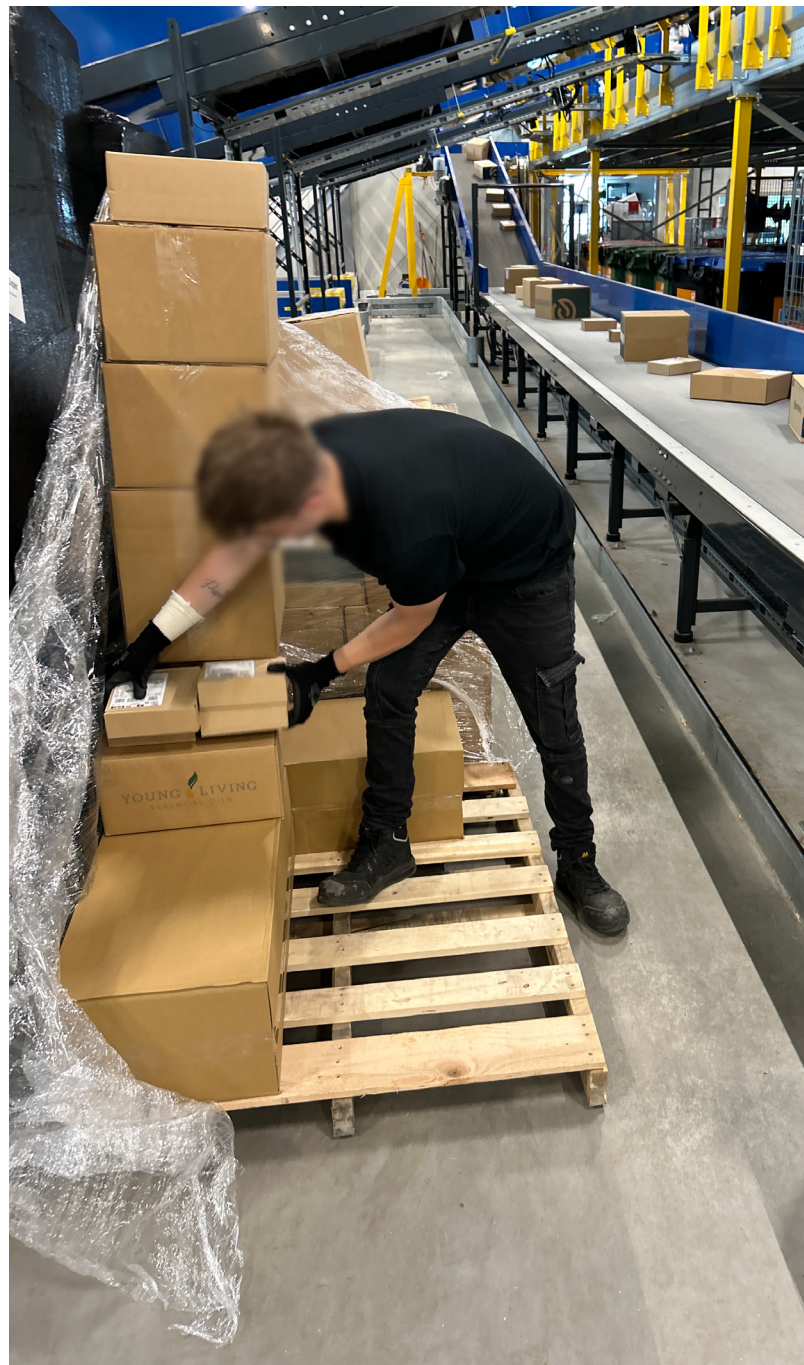
Het werk in het depot van een pakketbezorgdienst.

De markt voor pakketten is de afgelopen jaren enorm gegroeid. De consument krijgt een besteld pakketje snel en gratis geleverd en mag het meestal gratis terugsturen. Dat veroorzaakt een keten aan handelingen met pakketten. Het depot is de schakel tussen de leverancier en de pakjesbezorger. Hier moet alles snel. Elk pakje wordt met de hand van een rolcontainer of pallet op een lopende band gelegd, waarna het via een aantal lopende banden bij het eindstation van de juiste postcode uitkomt. Maarten: “Het feit dat alles handmatig gebeurde was voor ons als inspecteurs echt een verrassing. Hier lijkt vernieuwing totaal afwezig. Ook de volle rolcontainers worden handmatig verplaatst en niet eentje maar ‘een treintje’ van 5 à 6 stuks. In elk depot is ook nog een bijzondere plek te vinden, speciaal voor pakketten met afwijkende maten. Denk aan winterbanden, trekhaken, diervoeding en snowboards.