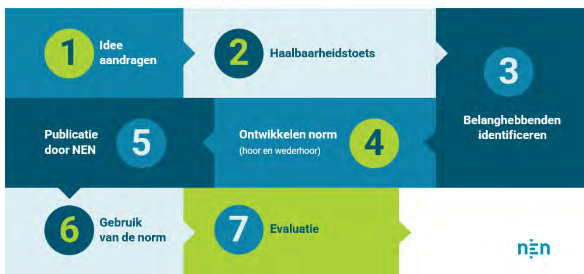
Afbeelding 1, de zeven stappen van normalisatie.

De leidraad 'Duurzame medische hulpmiddelen: single-use én reusable' opgesteld door het NEN Platform Duurzaamheid & Medische Hulpmiddelen is gebruikt als basisinformatie voor deze verkenning. De leidraad is opgesteld door een brede groep stakeholders en biedt een handvat aan de sector om binnen de huidige wet- en regelgeving stappen te zetten op het gebied van de verduurzaming van medische hulpmiddelen.