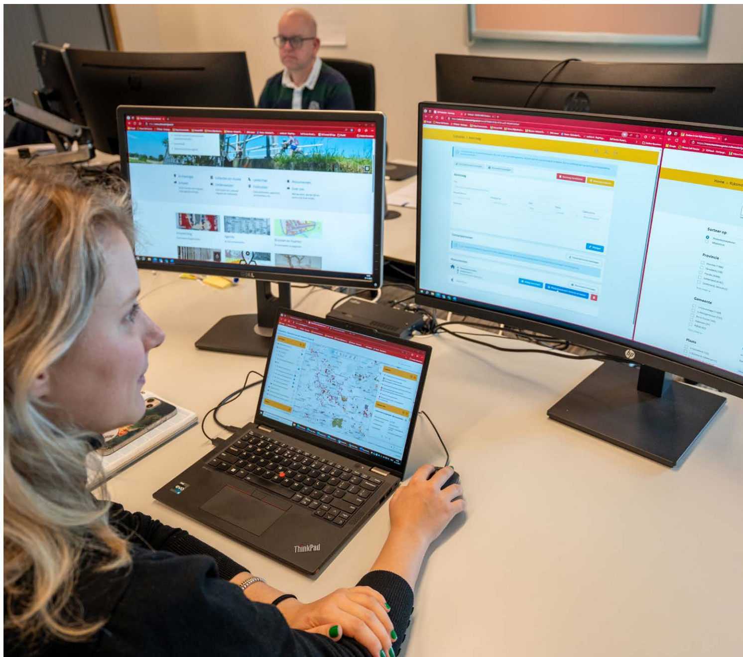
Een medewerker van de InfoDesk helpt een monumenteneigenaar bij het online aanvragen van subsidie. De RCE is op werkdagen per telefoon en mail bereikbaar voor iedereen met vragen over cultureel erfgoed.

De digitale vragen en eisen vanuit de samenleving nemen toe, maar erfgoedpartners en de RCE hebben niet genoeg capaciteit en middelen om aan deze vraag te voldoen en de noodzakelijke nodige ontwikkelstappen te zetten. De eisen rond vindbaarheid, toegankelijk- >>