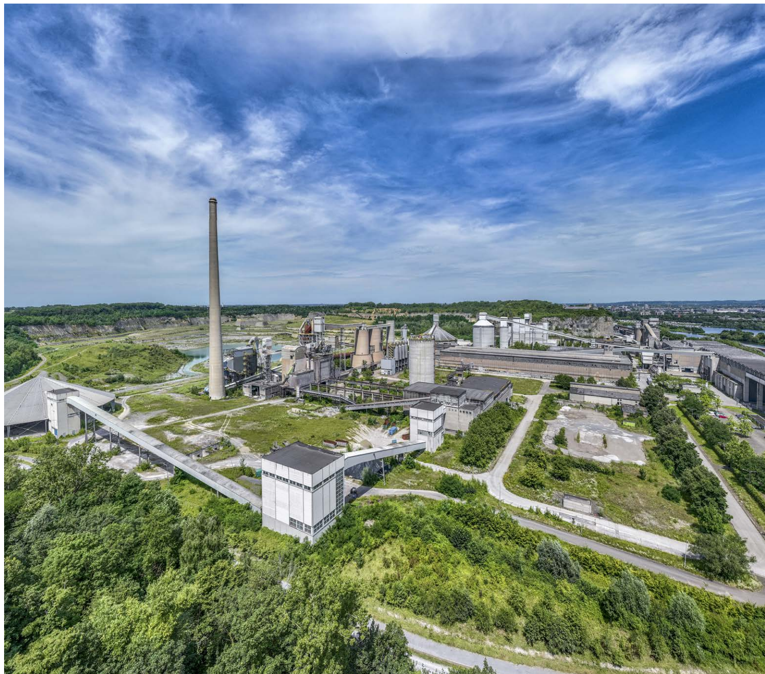
Op het terrein van de voormalige cementfabriek ENCI bevinden zich vijf rijksmonumenten. De mergelgroeve in Maastricht vormt samen met de bedrijfsgebouwen en installaties een landschap dat bijzonder is voor Nederland.