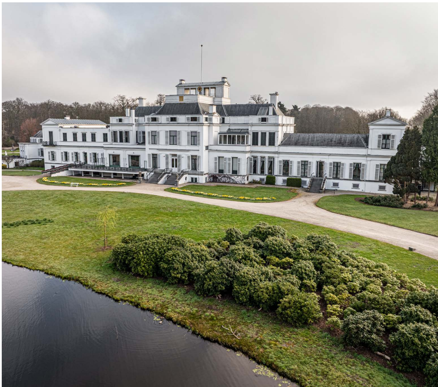
De eigenaar van Paleis Soestdijk zoekt een nieuwe bestemming voor het markante rijksmonument. Hierover worden gesprekken gevoerd met de RCE en de gemeente Baarn.

Door deze tekorten neemt de kwaliteit van de erfgoedzorg af. Kennis en professionaliteit binnen de sector staan onder druk, mede merkbaar doordat uit capaciteitsgebrek steeds vaker vrijwilligers >>