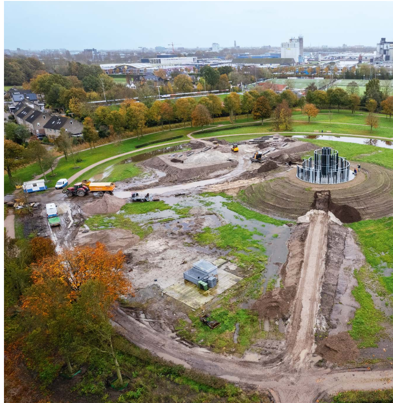
In Zwolle zijn de resten van het middeleeuwse kasteel Voorst als archeologisch rijksmonument beschermd. Op initiatief van wijkbewoners en in samenwerking met de gemeente en RCE is de geschiedenis zichtbaar gemaakt door een kunstwerk aan te brengen.

Een ander belangrijk onderdeel van onze werkzaamheden is het verstrekken van subsidies aan eigenaren van erfgoed. Deze subsidies zijn gericht op instandhouding, herbestemming en verduurzaming, en hebben tot doel om monumenten een duurzame toekomst te bieden. Op deze manier dragen we bij aan het behoud van ons waardevolle cultureel erfgoed en zorgen we ervoor dat het erfgoed ook voor toekomstige generaties bewaard blijft.