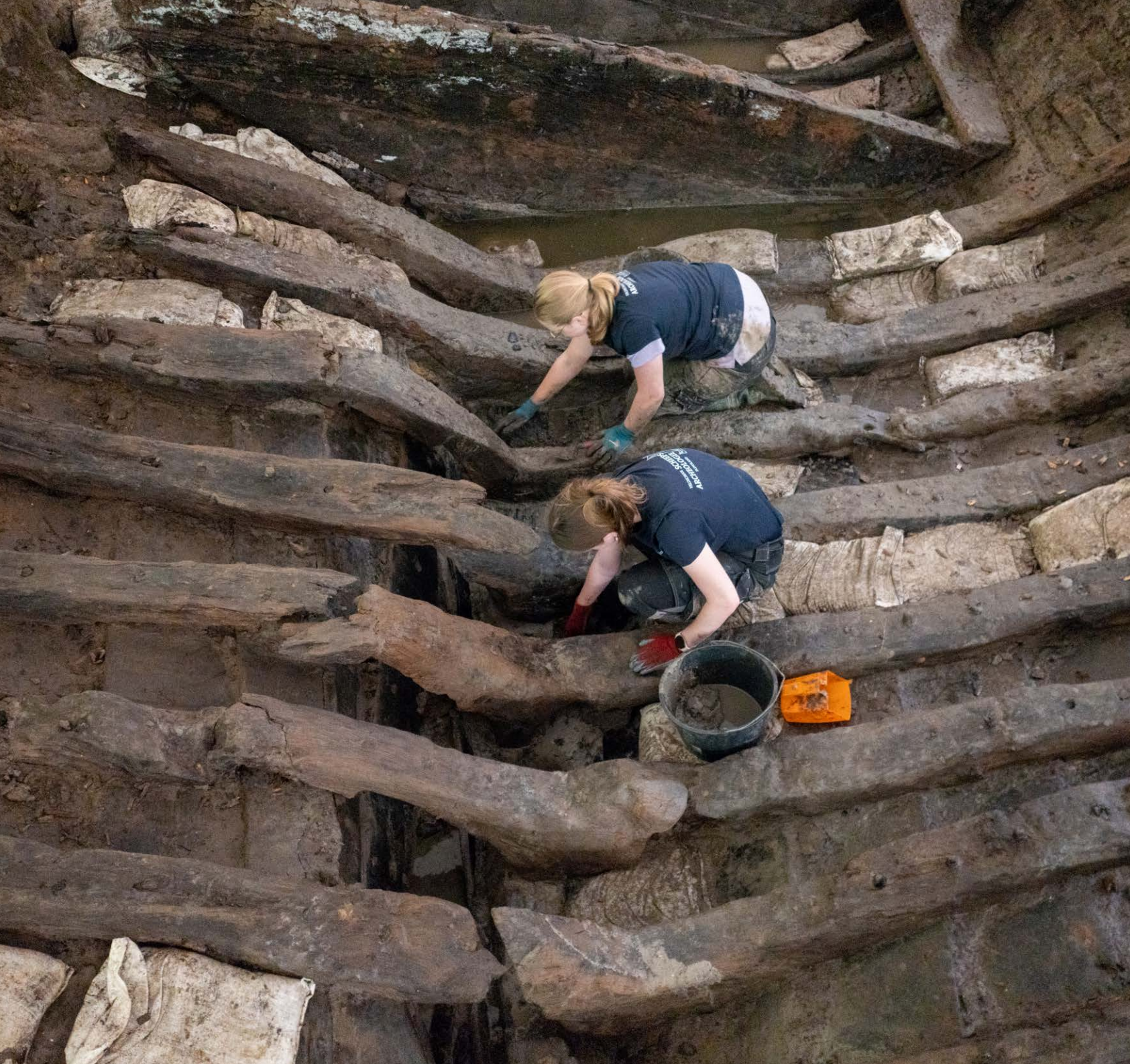
Foto cover: De veertiende-eeuwse Jacobuskerk te Zeerijp ligt midden in het aardbevingsgebied in Groningen. Met alle betrokken adviseurs worden de te nemen versterkingsmaatregelen ter plaatse doorgenomen. (Foto RCE, Jarno Pors)

Foto achter: Elk jaar organiseert de Rijksdienst voor het Cultureel Erfgoed in samenwerking met Batavialand de Veldschool Scheepsarcheologie Flevoland. Studenten van verschillende scholen en universiteiten doen onderzoek naar een scheepswrak. (Foto RCE, Jarno Pors)