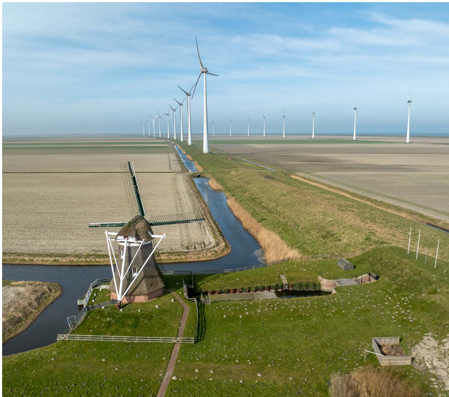
De molen de Goliath in de Eemspolder heeft geen functie meer en wordt tegenwoordig omringd door windturbines. Een groot contrast tussen historisch en hedendaags gebruik van windenergie.

Toch blijkt uit evaluaties dat erfgoed vaak niet goed wordt benut in ruimtelijke plannen. Het krijgt in de beginfase van visievorming nog aandacht, maar verdwijnt bij de uitvoering naar de achtergrond. Vaak komt erfgoed pas weer in beeld bij de vergunningverlening, wanneer de focus ligt op herstel in plaats >>