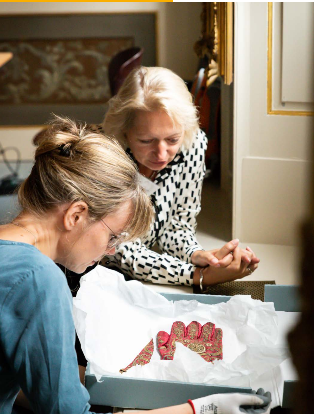
Onderzoekers van het Rijkserfgoedlaboratorium verrichten materiaal-technisch onderzoek, ook op locatie.